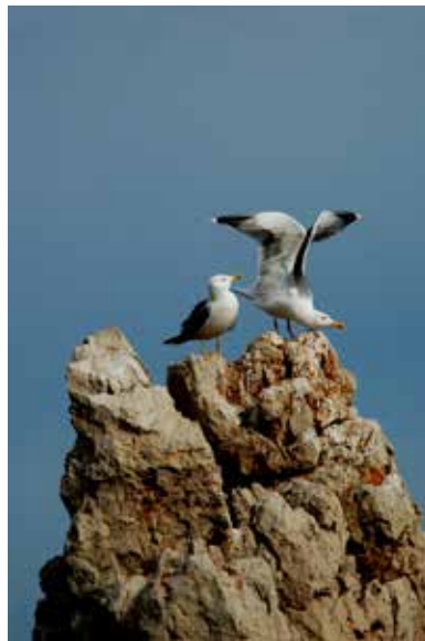
BELLEZZA SENZA VANITÀ di Pietro Finisguerra

Le fotografie premiate e quelle ritenute significative dalla commissione saranno esposte dal 16 al 18 maggio p.v., all'interno dell'Ottagono di S.Caterina in Piazza Duomo a Cefalù.