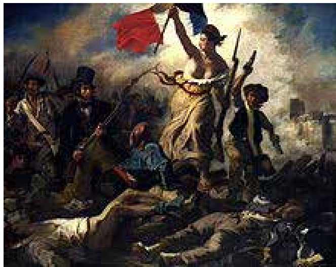
LIBERTÀ CHE GUIDA IL POPOLO DI EUGÈNE DELACROIX

Seguendo l'esempio della Tate di Liverpool e il